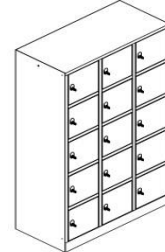
F53.400 5 Abteil vertikal Voll-Blech