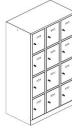
F43.400 4 Abteil vertikal Voll-Blech